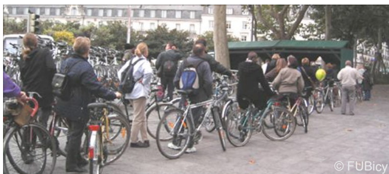
A Tours, Strasbourg, Lyon ou Lille, les cyclistes sont nombreux lors des séances Bicycode !

Nous conseillons de profiter du marquage pour sensibiliser le cycliste et l'inciter à se munir d'un antivol solide. Ainsi, le cycliste réduit fortement le risque de vol, et peut plus volontiers investir dans un vélo de qualité.